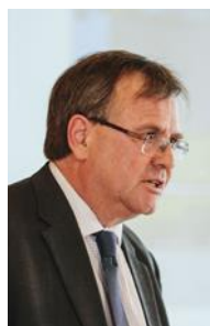
INTEGRATION IN DIE AUS- UND WEITERBILDUNG SICHERN.

dass Elektromobilität alltagstauglich ist. Dazu gehört auch der Aufbau einer ausreichenden Ladeinfrastruktur und eines Abrechnungssystems, das alltagstauglich ist. Nötig sind neue Ideen für Anwendungsbeispiele, die als Geschäftsmodelle entwickelt werden und sich als wirtschaftlich tragfähig erweisen.