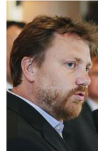
VIELE DER INNOVATIONEN VERDIENEN ES, BERÜCKSICHTIGT ZU WERDEN.

ve Verkehrskonzepte auf der Basis der Elektromobilität. Es kommt darauf an, aus diesem gut gefüllten Kasten die geeigneten Bausteine herauszufinden und daraus praktische Umsetzungsbeispiele zu machen! Nicht neue Expertengremien sind nötig, sondern konkrete Projekte, mit denen auch Erfahrungen für das weitere Vorgehen gesammelt werden. Wohngebiete, die heute entstehen, sollten von vornherein solche modernen Verkehrslösungen enthalten – das aber ist nicht der Fall. Die Zusammenarbeit mit den Energieerzeugern sollte sichern, dass elektrische Verkehrsströme auch mit erneuerbarem Strom betrieben werden und ihr Potenzial als Speicher nutzen. Auch dies ist bisher nicht der Fall, während überschüssiger Wind- und Sonnenstrom immer wieder aus dem Netz genommen werden muss. Hier liegen auch spannende Geschäftsfelder.